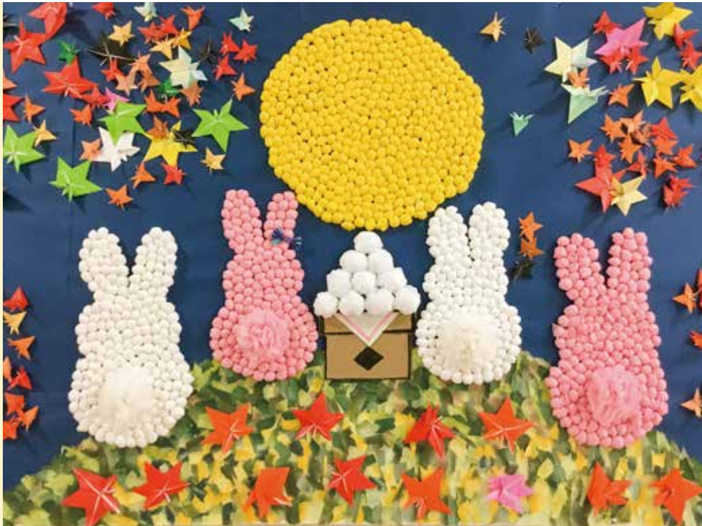
入所ご利用者様の作品